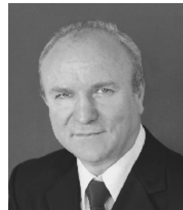
Constantin ROTARU Președinte PAS

Eu sunt convins că da, dar soluțiile de ieșire din criză într-un termen cât mai scurt și fără suferințe foarte mari din partea populației nu sunt pe placul celor care ne conduc. Atunci când spun cei care ne conduc mă refer atât la oamenii politici care ocupă toate funcțiile de conducere în administrația locală și centrală cât și la cei care, sub umbrela lor, au ajuns mari oameni de afaceri. La fel se întâmplă în toate statele capitaliste. Același comportament îl au statele