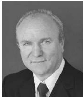
Constantin ROTARU Președinte PAS

Criza economică se manifestă în acea fază a ciclului economic în care supraproducția atinge punctul culminant în